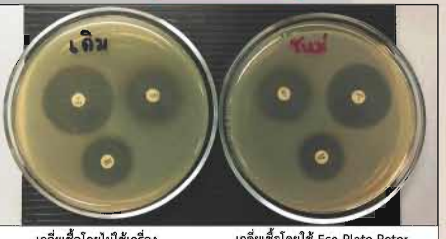
เกลี่ยเชื้อโดยไม่ใช้เครื่อง เกลี่ยเชื้อโดยใช้ Eco Plate Rotor