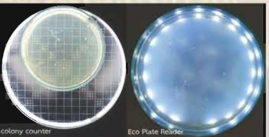
colony counter Eco Plate Reader