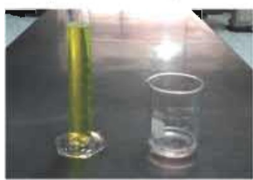
การเตรียมอุปกรณ์การล้าง