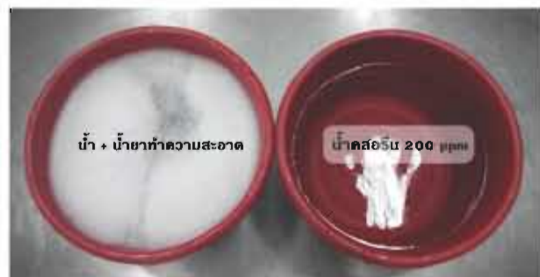
การเตรียมอุปกรณ์การล้าง